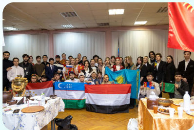
День дружбы народов