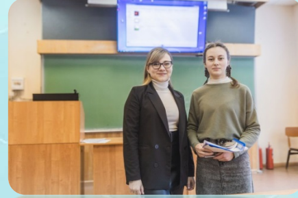
Создание системы студенческих научных объединений (СНО), Межрегиональный Слет СНО