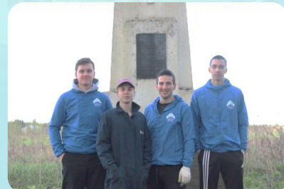
Добровольческая акция «Российских сёл живая память»