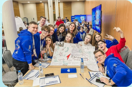
Создание первичного отделения КГСХА «Движение первых» - 2024 г.