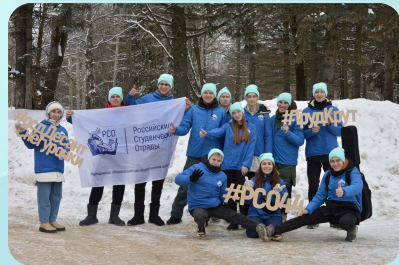
Волонтерский проект «Десант Снегурочки»