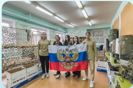
Создание волонтерских центров «Волонтеры КГСХА», «Тыл44» (2023г.)