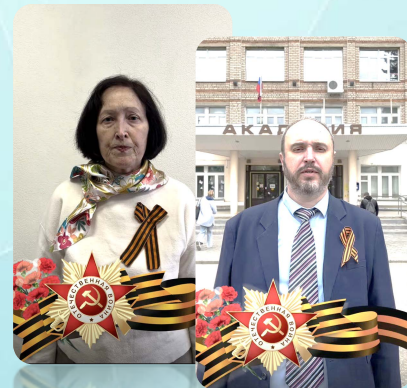
Патриотический медиапроект «Я помню, я горжусь»