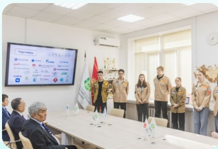
Мультиформатное молодежное пространство РСО «Созвездие» (в рамках ВКМП Росмолодежь.Гранты – 2024г.)