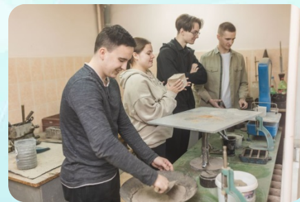
Образовательная программа обучения рабочим профессиям (в рамках гранта РСО – 2023г., 2024 г.)