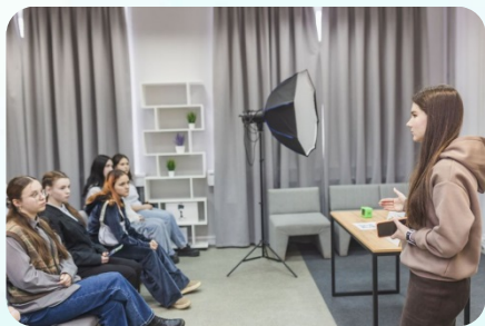
Молодежный медиасервис «Зёрна Медиа» (в рамках ВКМП Росмолодежь.Гранты – 2023г.)