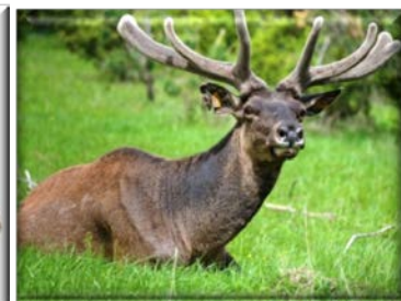
ООО «Костромской мараловодческий комплекс»