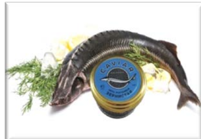
ООО «Волгореченское рыбное хозяйство»