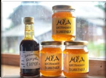
СППСК «Костромские пасеки»