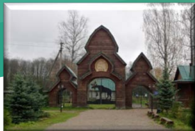
Природный заказник «Сумароковский»